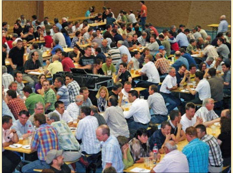
Erste Generalversammlung der Kleinbrauerei Stiär Biär AG.

Am Fassanstich der Saisonbiere und auch an anderen Anlässen ist Stiär Biär offen für alle. Vielleicht haben auch Sie bereits an einer unserer Veranstaltungen teilgenommen. Wir hoffen, das hat Ihnen so viel Freude bereitet wie uns!